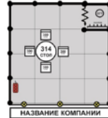
Стенд 12 - 17 кв.м. 1кВт