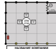
Стенд 18 - 24 кв.м. 2кВт